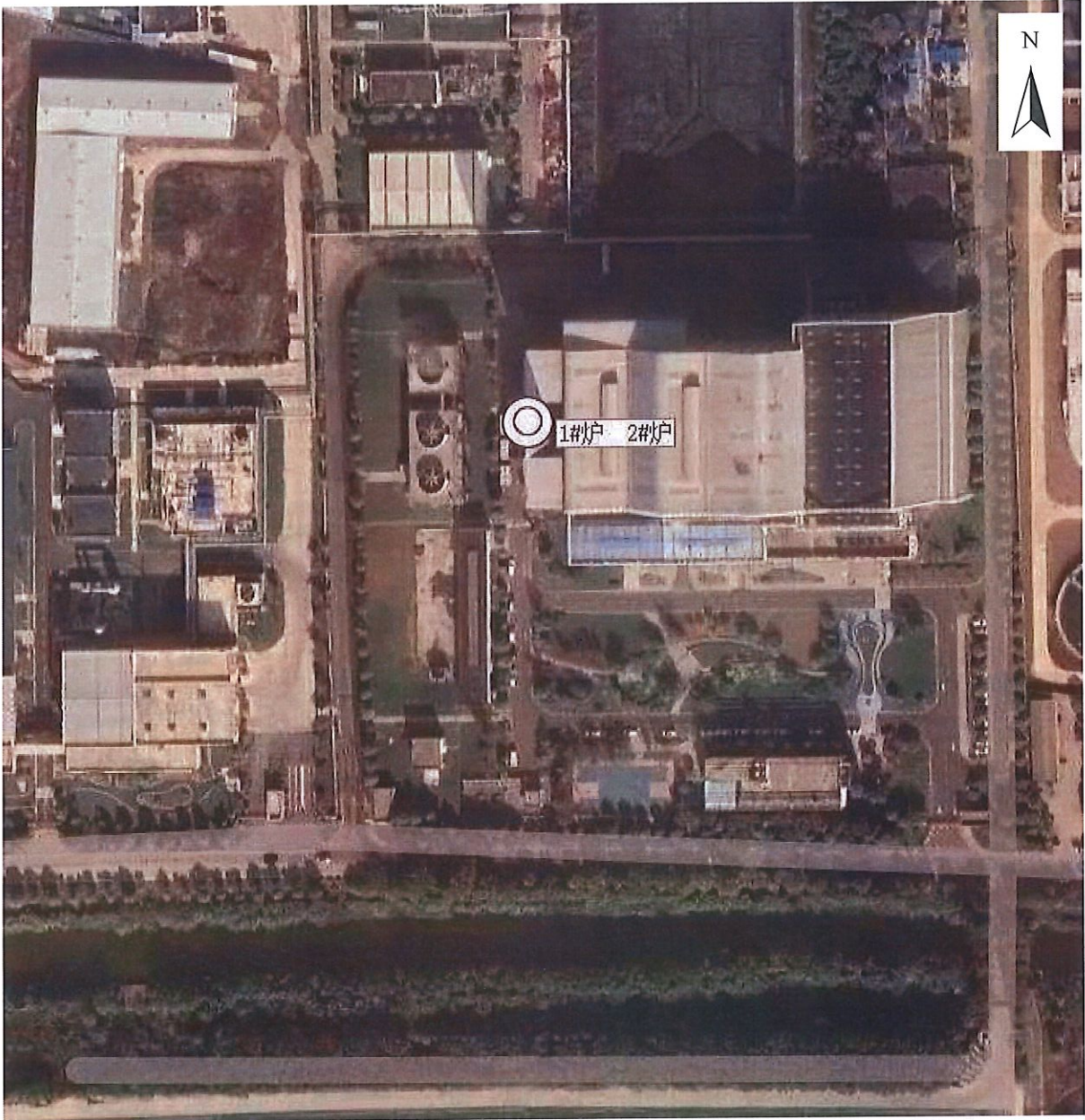
附图 1：监测点位示意图