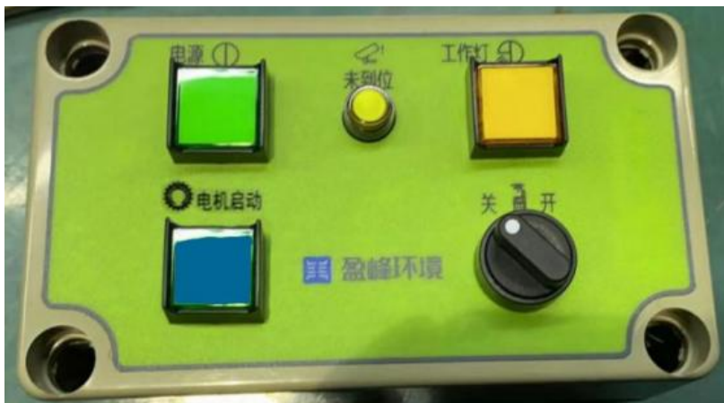
驾驶操作室内操作盒

产品作业操控装置有两处（若选配有遥控则为三处），其中一处是在驾驶室的控制面板，另外一处是在车辆后部右侧的操控盒。